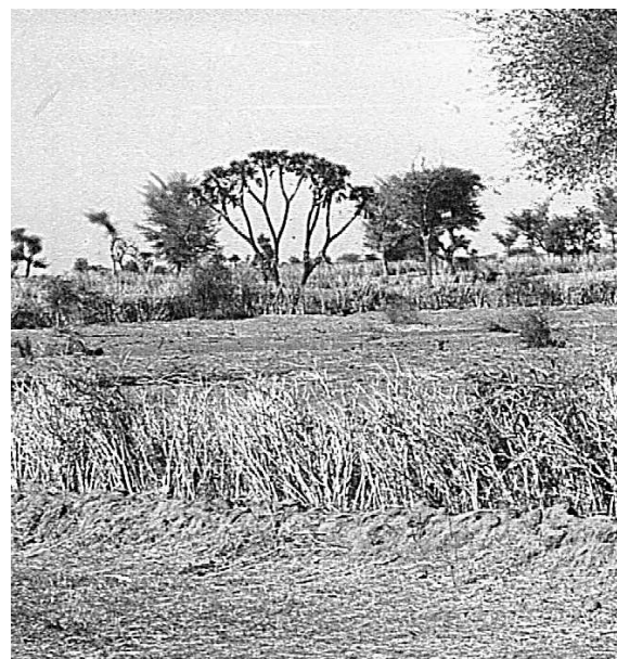
Brise vent en haie d'eucalyptus, Dori, Burkina Faso