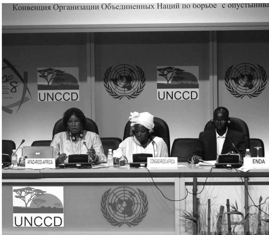
COP 8, ODS, Madrid, 2007