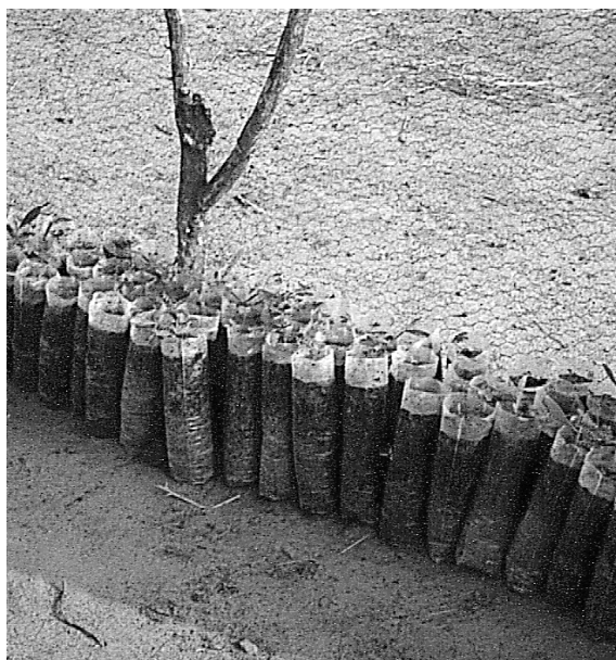
Pépinière forestière, Burkina Faso