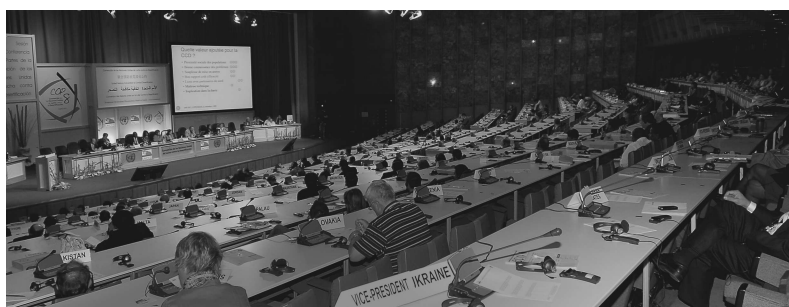
COP 8, Plénière, Madrid, 2007