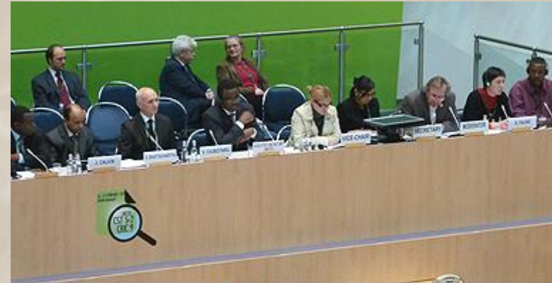
The CSOs Open Dialogue Session